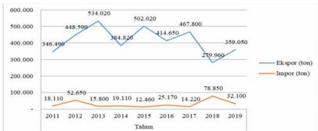
Gambar 1.1 Grafik Volume Ekspor dan Impor Kopi Indonesia pada Tahun 2011-2019 (Ton) (Outlook Kopi, 2020)

Kopi ( Coffea sp ) merupakan komoditas perkebunan yang memiliki peranan penting dalam menyumbang pertumbuhan perekonomian Indonesia. Peran penting komoditas kopi terhadap pertumbuhan ekonomi negara masih terkendala dengan pengembangan kopi. Sebesar 96% tanaman kopi dibudidayakan oleh rakyat, dimana kondisi tersebut berpengaruh terhadap kualitas kopi yang dihasilkan. Kopi yang usahakan oleh rakyat masih belum sesuai dengan GAP ( Good Agriculture Practise ), dimana sebagian besar petani masih menggunakan bibit asalan, kelembagaan yang belum terorganisir dan menggunakan teknologi pasca panen dan pengolahan yang masih terbatas. Gambar 1.1 adalah data ekspor dan impor kopi Indonesia pada tahun 2011-2019.